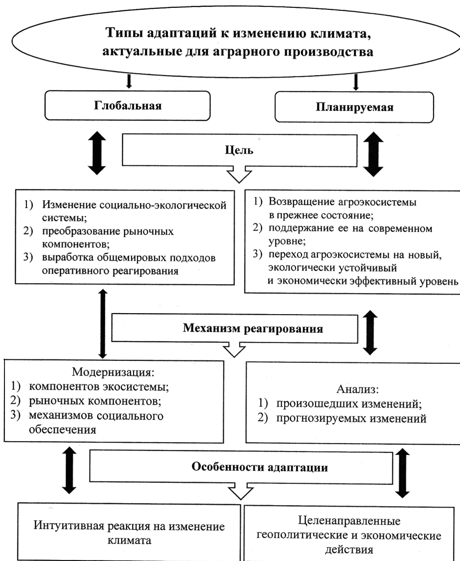
Рис. 1. Типы адаптаций

Экономическая оценка планируемых агрофитоценозов напрямую зависит от их функций, в числе которых товаропроизводящая, эколого-климатическая, экономическая, сохраняющая. В основе первой лежит производство основной и побочной продукции. Вторая включает механизм максимизации поглощения углекислого газа, минимизации использования химических средств, регулирования водно-воздушного режима. Третья функция базируется на подборе высокоэффективных технологий, высокопродуктивных сортов и гибридов сельскохозяйственных