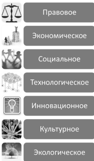
Рисунок 2. Направления работы в сельской местности

В регионах имеются образовательные учреждения высшего образования, дополнительного профессионального образования Минсельхоза России, материальная база, кадры, опыт работы с сельским населением. Созданы подразделения ИКС, АККОР, Ревизионные союзы, Агропромсоюзы, центры компетенций кооперации, центры кластерного развития, центры технологической компетенции, бизнес-инкубаторы, фонды, агропромпарки и другие структуры по поддержке села. Для объединения усилий, координации действий названных структур и достижения синергетического эффекта необходима поддержка Минсельхоза России в создании межотраслевых региональных центров поддержки устойчивого развития сельских территорий.