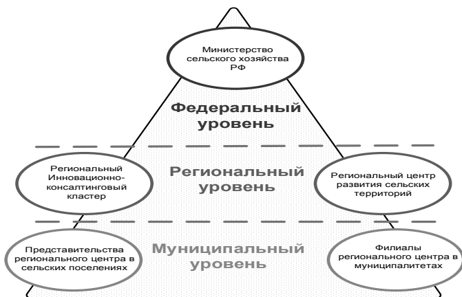
Рисунок 1. Единая общероссийская, вертикально интегрированная система поддержки устойчивого развития сельских территорий

Для устойчивого развития села необходимо формировать единую общероссийскую, вертикально интегрированную систему поддержки устойчивого развития сельских территорий, предусматривающую создание региональных центров поддержки комплексного развития сельских территорий на базе учреждений высшего образования (дополнительного профессионального образования) Минсельхоза России с филиалами в муниципалитетах и представительствами в сельских поселениях (рисунок 1).