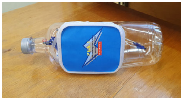
Рисунок3. Готовый прототип РБА-1

Установка предлагаемого устройства даст возможность своевременно предупредить оператора крупногабаритной техники об приближении к ЛЭП на nepoзвoлитeльнoe расстояние, и тем самым обеспечит его защиту от поражения электрическим током.