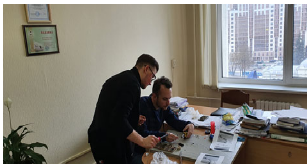
Рисунок 2. Процесс разработки РБА-1

Работа по первому устройству ведется до сих пор, но для демонстрации был разработан более упрощенный сигнализатор РБА-1 (рисунок 2,3), который показал свою работоспособность (срабатывает световая и звуковая сигнализация) для работы в помещениях. Готовим программу испытаний в натуральных условиях под ЛЭП, в т.ч. с установкой на крупногабаритной мобильной технике.