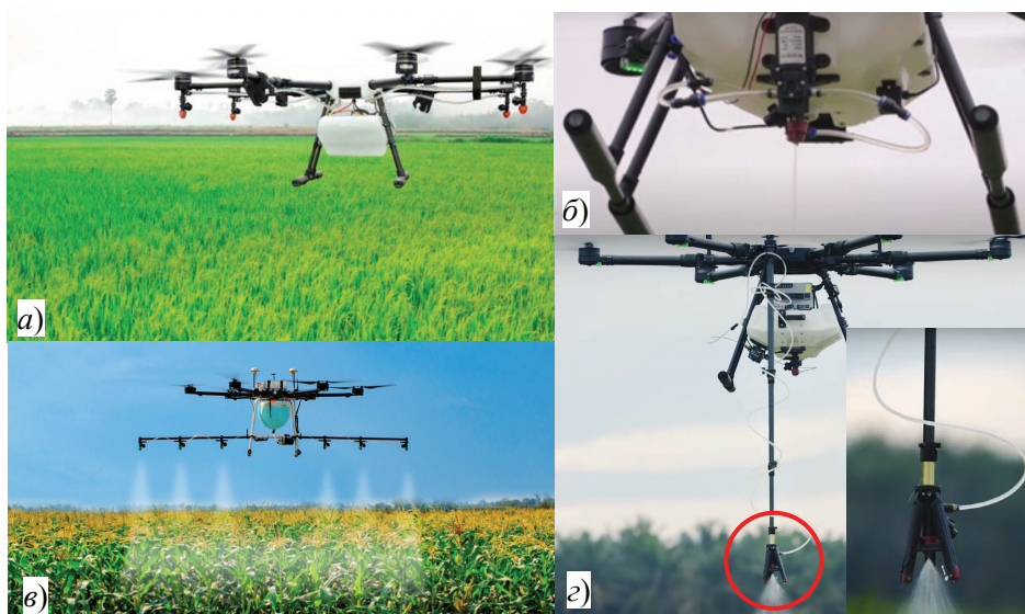
Рис. 1. Мультикоптеры-опрыскиватели, применяемые для сплошного ( а , в ) и точечного ( б , з ) опрыскивания

Большинство современных видов мультикоптеров-опрыскивателей имеет типовую конструкцию, содержащую несколько форсунок, размещенных на концах горизонтальных лучей рамы непосредственно под пропеллерами (рис. 1, а ) [1]. В некоторых их видах форсунки размещаются на горизонтальной штанге, установленной в нижней части под баком с рабочей жидкостью (рис. 1, в ) [2]. Такие мультикоптеры обычно применяются для сплошного опрыскивания, поскольку формируют широкую (в несколько метров) полосу распыления рабочей жидкости. Точечное опрыскивание осуществляется мультикоптерами особой конструкции, отличающейся наличием только одной форсунки, которая размещается непосредственно под баком с рабочей жидкостью (рис. 1, б ) или устанавливается на нижнем конце вертикальной распылительной телескопической штанги, закрепленной на раме (рис. 1, з , форсунка показана на отдельной вставке) [3]. Используя такие мультикоптеры, можно проводить опрыскивание с разной степенью локализации (критерий E_{л} (1)): путем перемещения мультикоптера вдоль линий расположения отстоящих друг от друга растений, подлежащих обработке, при постоянно включенной форсунке, так что непрерывно выходящая струя распыла попадает