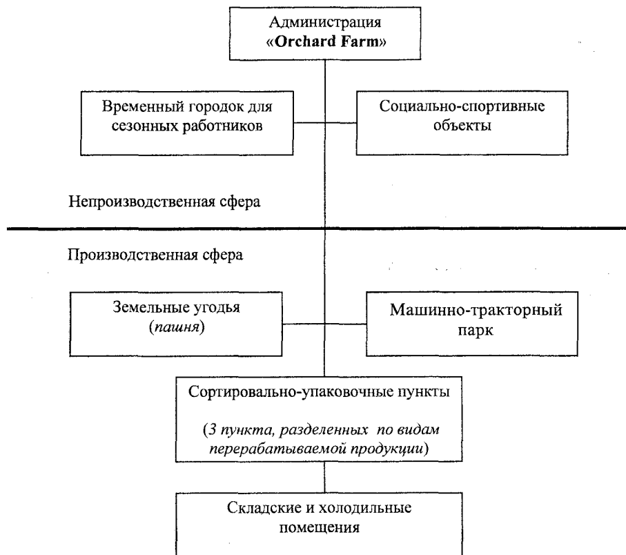
Рис. 1. Внутренняя структура компании «Orchard Farm»

вом автотранспорте. При транспортировке на небольшое расстояние (до 50 километров) используют машины с закрытым кузовом, при более дальних маршрутах применяют грузовики с холодильными и терморегулирующими камерами.