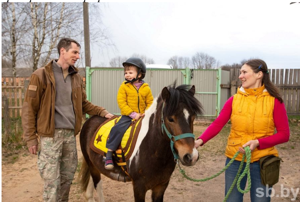
Детям в деревне раздолье

– Он включает дополнительные выплаты к основной зарплате и единовременные подъемные, которые специалисты получают, когда приходят после вузов либо возвращаются из армии. При вступлении в брак молодожены также получают денежную помощь. Предусмотрены и единовременные выплаты при рождении детей: за первого и второго ребенка матерям – 300 рублей, отцам – 100, за третьего и последующих мамам – 400 рублей, папам – 200. Есть у нас и оплата труда в натуральном выражении: ежемесячно выдаем работникам продукты собственного производства (куры, колбасы, сливочное масло) на общую сумму 60 рублей. Значительные средства вкладываем в оздоровление своих сотрудников и их детей: в качестве поощрения взрослых дважды в год – весной и осенью – отправляем отдохнуть в Трускавец. Дети ездят в оздоровительный лагерь «Сузор'е»: основную часть стоимости путевки оплачивают предприятие и профсоюз.