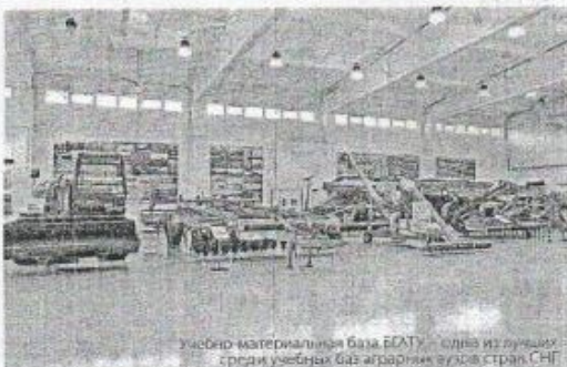
Учебно-материальная база БГАТУ – одна из лучших среди учебных баз аграрных вузов стран СНГ

совместно формируются студенческие сельскохозяйственные отряды на территории Республики Беларусь и Российской Федерации.