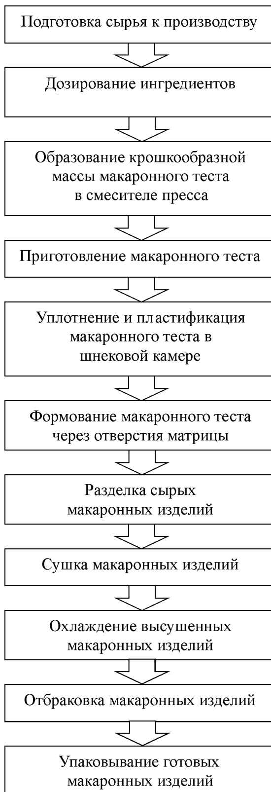
Рис. 1. Технологическая схема производства макаронных изделий Fig. 1. Technological scheme of production pasta

Продолжительность замеса зависит от вида смеси и технологического оборудования и составляет от 3 до 20 минут.