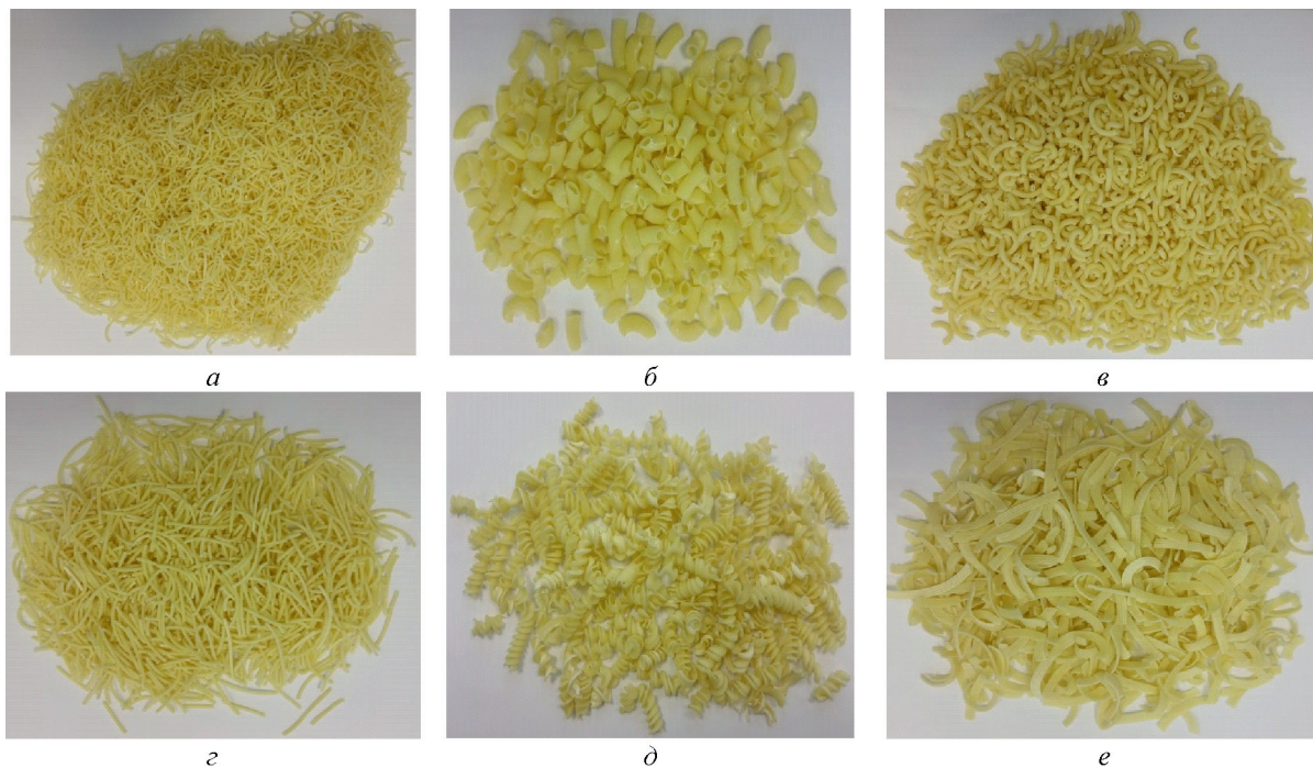
Рис. 4. Виды макаронных изделий: а — вермишель мелкая; б — рожки большие; в — рожки мелкие; г — вермишель большая; д — спиральки; е — лапша