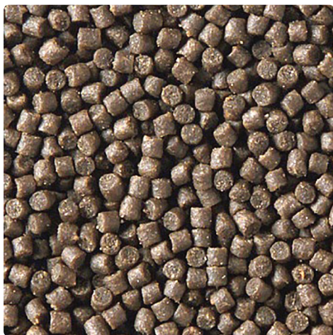
Рис. 1. Экструдированный комбикорм для сеголетков лососевых рыб. Разработка Института рыбного хозяйства Национальной академии наук Беларуси, 2013 г.

Институт рыбного хозяйства Национальной академии наук Беларуси занимается разработкой научно обоснованных рецептур комбикормов для ценных видов рыб. Так, в 2013 г. был разработан комбикорм экструдированный для сеголетков лососевых рыб и технические условия на него (ТУ BY 100035627.015–2013). Комбикорм предназначен для кормления сеголетков лососевых рыб массой 30 г и выше и представляет собой гранулы темно-коричневого цвета диаметром 2–4 мм. Производится комбикорм на основе местного сырья с добавлением импортного соевого шрота и рыбной муки. Содержит полный набор питательных веществ, обогащен витаминами, микро-, макроэлементами и ненасыщенными жирными кислотами. Массовая доля влаги – не более 12,0 %, сырого протеина – не менее 45,0 %, сырого жира – не менее 15,0 %, сырой клетчатки – не более 2,0 %. Разбухаемость гранул – не менее 20 мин. Срок хранения – 3 месяца. Комбикорм прошел сравнительные испытания на радужной форели в рыбопитомнике «Богушевский» и показал хорошие результаты, сопоставимые с зарубежным. Он обеспечил хорошее физиологическое состояние и интенсивный рост рыбы [3–5].