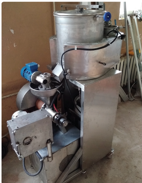
Рис. 3. Лабораторный кондиционер и экструдер. Разработка Научно-практического центра Национальной академии наук Беларуси по продовольствию, 2018 г.

Fig. 3. Laboratory conditioner and extruder. Development of Research and Production Center of the National Academy of Sciences of Belarus for Foodstuff, 2018