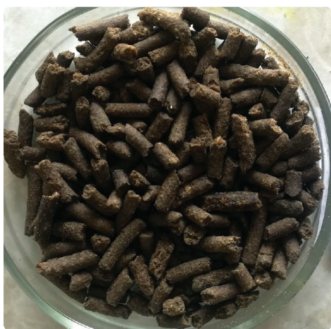
Рис. 4. Продукционный экструдированный комбикорм для осетровых рыб, произведенный на лабораторном оборудовании. Разработка Института рыбного хозяйства Национальной академии наук Беларуси, 2018 г.

Fig. 3. Laboratory conditioner and extruder. Development of Research and Production Center of the National Academy of Sciences of Belarus for Foodstuff, 2018