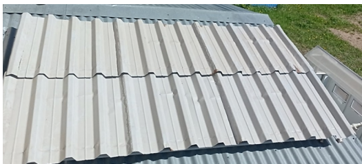
Рисунок 2 – Солнечный коллектор

Для решения данной проблемы было сконструировано устройство для нагрева воды за счет солнечной энергии [3]. Данное устройство выполнено с использованием кровли крыши в качестве элемента солнечного коллектора.