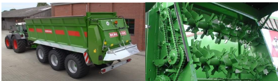
Рис. 2. Универсальный разбрасыватель TSW 7340S фирмы «BERGMANN»: а) общий вид; б) фрезерный агрегат

За счет наклона витков фрезера к горизонту под углом 45^\circ и прикрученных в паре сегментов (на каждом барабане 66 сегментов) контакт инородного тела с барабаном получается скользящим. Как результат – вероятность выхода из строя привода измельчающих и распределяющих рабочих органов сводится к минимуму. Количество лопаток на дисковом распределителе – 12 штук (по 6 лопаток на распределяющий диск). Противоизносные лопатки имеют 2 ребра жесткости. На распределяющих дисках имеются отверстия с одинаковым шагом для обеспечения регулировки угла атаки лопаток. Ширина разбрасывания материала достигает 25 м, доза внесения – от 1,5 т/га. Фирма «FARMTECH» (Словения) предлагает потребителям универсальные разбрасыватели модели MEGAFEX (рис. 3).