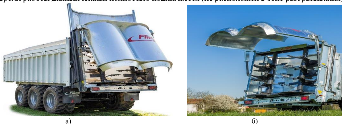
Рис. 4. Универсальный разбрасыватель ASW 373 «Tiger» фирмы «Fliegl» а) общий вид; б) фрезерный агрегат с вертикальными рабочими органами

Данный универсальный разбрасыватель имеет фрезерный агрегат, но лопатки на диске закруглены, не имеют ребер жесткости, а регулировка угла атаки составляет от 0 до 20^\circ . Защитный демпфер и регулировка высоты крышки предохранительного щитка отсутствуют. На зарубежных рынках также немало производителей выпускают универсальные разбрасыватели, у которых фрезерный агрегат выполнен вертикального исполнения. Так, например, фирма «Fliegl» выпускает универсальный разбрасыватель ASW 373 «Tiger» для тяжелых условий эксплуатации (внесение дефеката, сыромолотого доломита, известняка, мела и др.) (рис. 4) [8]. Данной машине не нужен защитный демпфер клапана и предохранительный щиток, так как во время работы данный клапан полностью поднимается (не расположен в зоне разбрасывания).