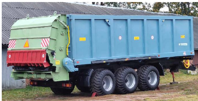
Рис. 5. Система транспортно-технологическая СТТ-25

сказанное, исследования в данной области становятся актуальными и для нашей страны. В качестве базовой машины для изучения процесса внесения сыромолотых форм известковых материалов использована ранее разработанная в РУП «НПЦ НАН Беларуси по механизации сельского хозяйства» транспортно-технологическая система СТТ-25 для внесения твердых органических удобрений (рис. 5).