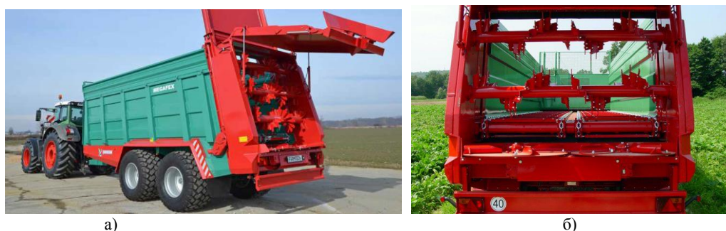
Рис. 3. Универсальный разбрасыватель MEGAFEX фирмы «FARMTECH» а) общий вид; б) подающий транспортер и фрезерный агрегат

За счет наклона витков фрезера к горизонту под углом 45^\circ и прикрученных в паре сегментов (на каждом барабане 66 сегментов) контакт инородного тела с барабаном получается скользящим. Как результат – вероятность выхода из строя привода измельчающих и распределяющих рабочих органов сводится к минимуму. Количество лопаток на дисковом распределителе – 12 штук (по 6 лопаток на распределяющий диск). Противоизносные лопатки имеют 2 ребра жесткости. На распределяющих дисках имеются отверстия с одинаковым шагом для обеспечения регулировки угла атаки лопаток. Ширина разбрасывания материала достигает 25 м, доза внесения – от 1,5 т/га. Фирма «FARMTECH» (Словения) предлагает потребителям универсальные разбрасыватели модели MEGAFEX (рис. 3).