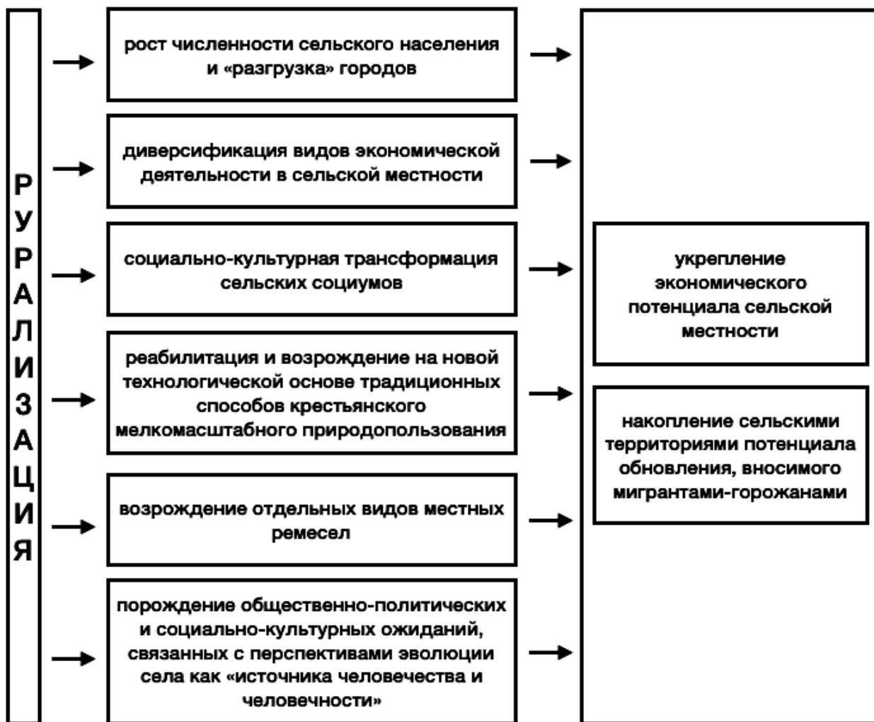
Рисунок 3. Ожидаемые положительные эффекты рурализации

Как показали исследования, изложенные в источниках [7; 9], жизненные практики «новых сельчан» резко контрастируют с «предметной деятельностью» коренных сельчан, поскольку активность первых не ограничивается своим домохозяйством или поселением, а благодаря Интернету, она не имеет пространственных границ. Через социальные сети они организуют праздники, собирающие не только жителей окрестных сельских поселений, но и горожан, которым для этого необходимо преодолеть сотню