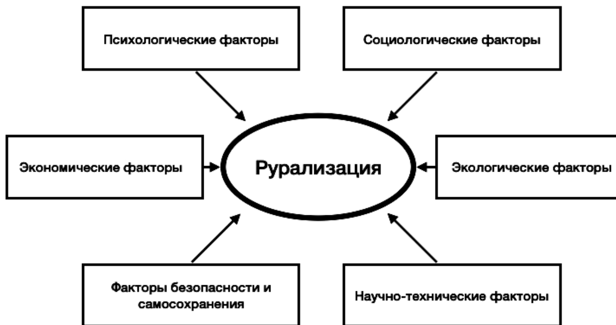
Рисунок 1. Факторы рурализации

Экономические факторы , которые точнее можно назвать экономико-прагматическими и отнести к выталкивающим, также оказывают влияние на процесс рурализации. Прагматизм проявляется в поиске и возможности получения необходимых благ по бо-