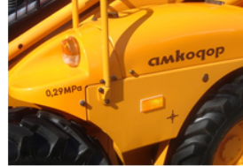
Рисунок 1 – Дополнительная анимация с таблицей перевода единиц измерения и фото погрузчика Амкор

Применение таких приемов визуализации информации положительно и заинтересованно воспринимается студентами как очной, так и заочной форм обучения [2]. В теме «Теория напряженно-деформированного состояния» в выводе закона Гука при сдвиге и определении положения главных площадок по отношению к площадкам сдвига, получается выражение: