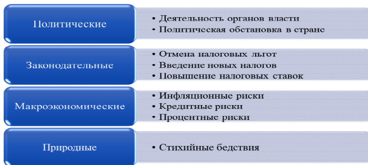
Рисунок 1. Внешние факторы рисков

Рассмотрим внешние предпринимательские риски в деятельности малого предпринимательства (рис. 1).