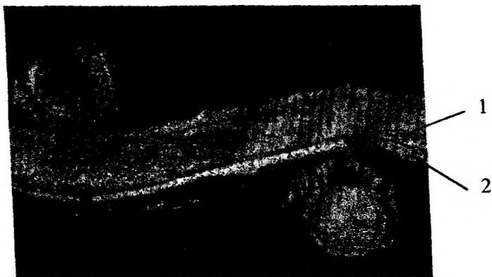
Рис. 2. Микроструктура жаростойкого сетчатого материала: 1 - основа, 2 - слой жаростойкого материала.

Изготовленный макетный образец искрогасителя с использованием жаростойких фильтрующих материалов на основе стальных сеток представлен на рисунке 3.