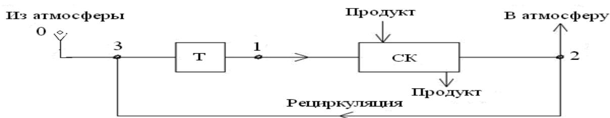
Рисунок 1. Принципиальная схема сушильной установки с рециркуляцией сушильного агента