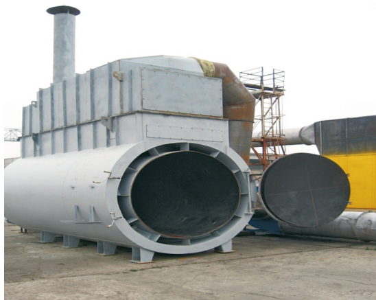
Рисунок 1.— Общий вид воздухонагревателя АТС-1,0

Развивая направление использования соломы как топлива в сельскохозяйственном производстве, ученые РУП «НПЦ НАН Беларуси по меха-