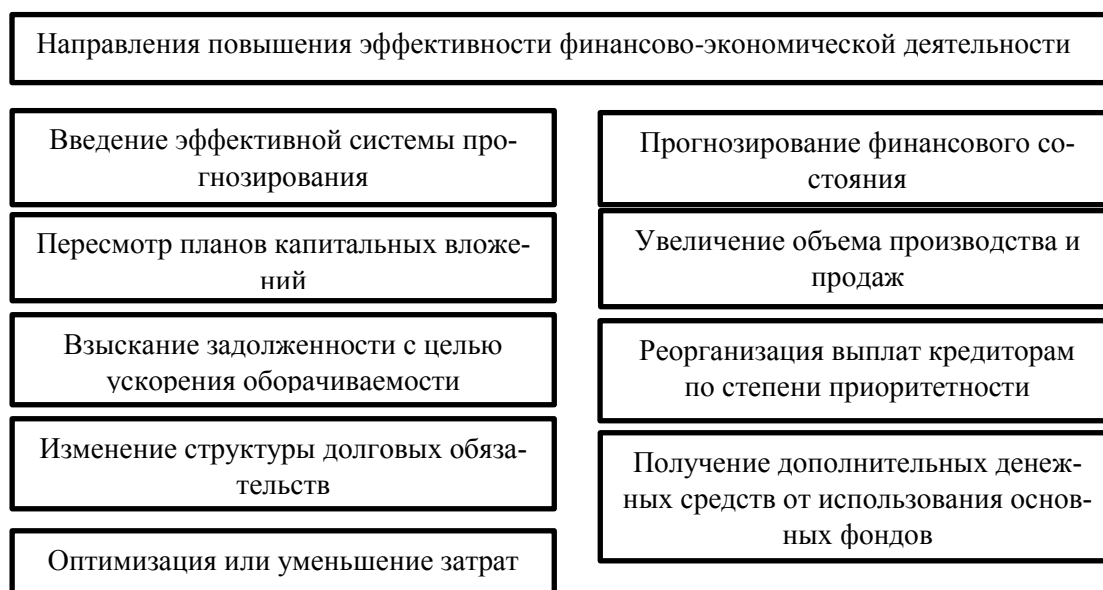
Рис. 2 – Направления повышения эффективности финансово-экономической деятельности сельскохозяйственного предприятия.

Для предупреждения ухудшения состояния финансово-экономической деятельности сельскохозяйственного предприятия целесообразно: