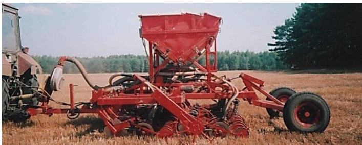
Рисунок 44 – Сеялка зернотукотравяная прямого посева СПП-3,6

оструктуривание тяжелых почв только механическим способом (рыхлением) не обеспечивает полного успеха. В результате чередования дождей и сухой погоды почвы вновь приобретают монолитную глыбистую структуру, в которой ухудшается микробиологический процесс и развитие растений.