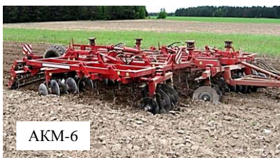
Рисунок 40 – Агрегаты комбинированные для минимальной обработки почв

Еще большей универсальностью и функциональностью обладает новый агрегат почвообрабатывающий многофункциональный АПМ-6, освоенный в производстве ОАО «Бобруйксельмаш» (рисунок 41).