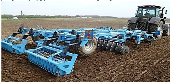
Рисунок 45 – Агрегат комбинированный для безотвальной обработки тяжелых почв АБТ-4

РУП «НПЦ НАН Беларуси по механизации сельского хозяйства» разработало комбинированный агрегат безотвальной обработки почвы АБТ-4 (рисунок 45), который предназначен для безотвальной обработки почв на глубину до 30 см с мульчированием, выравниванием и прикатыванием поверхности поля. Используется на обработке почвы по следующим агрофонам: стерня озимых и яровых зерновых и зернобобовых культур; осенняя зябь при полупаровой обработке почвы; поля после уборки кукурузы, свеклы и картофеля; весенняя зябь.