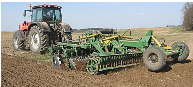
Рисунок 39 – Агрегат почвообрабатывающий дисковый АПД-6

Для выполнения первых неглубоких (до 12 см) обработок агрофонов после уборки различных культур разработан и осваивается в производстве ОАО «Бобруйсксельмаш» агрегат почвообрабатывающий дисковый АПД-6 (рисунок 39).