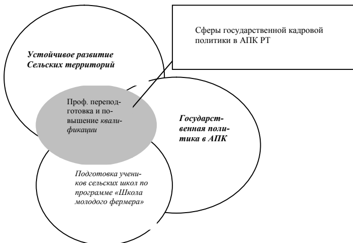
Рис. 3 Организация кадровой политики в АПК РТ

- совершенствование социальных механизмов профессионализации кадров АПК.