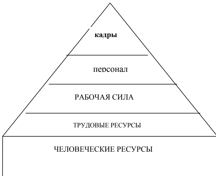
Рис.1. Объект кадровой политики

На наш взгляд, схематически дифференциация понятий, определяющих объект кадровой политики , показана на рис. 1.