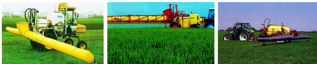
Рисунок 2. – Объемные опрыскиватели фирм Kyndestoft, RAU (Германия), Hardi (Дания)

Одним из решений для работы на высоких скоростях является применение объемных опрыскивателей с воздухораспределительными рукавами (рисунок 2).