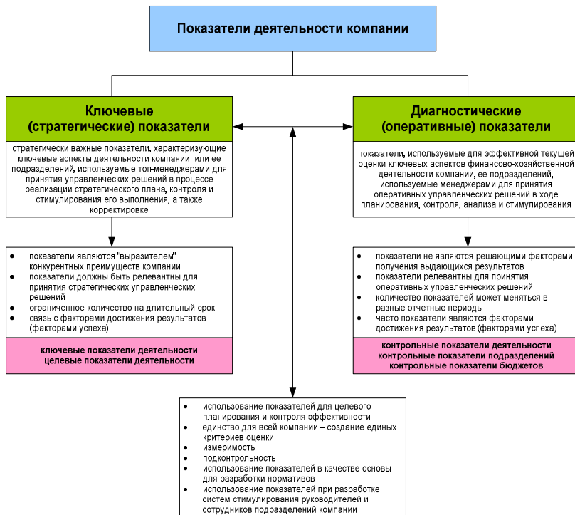
Рисунок 2. Стратегические и оперативные показатели деятельности предприятия

Ниже, на рисунке 2 представлены стратегические и оперативные показатели деятельности предприятия.