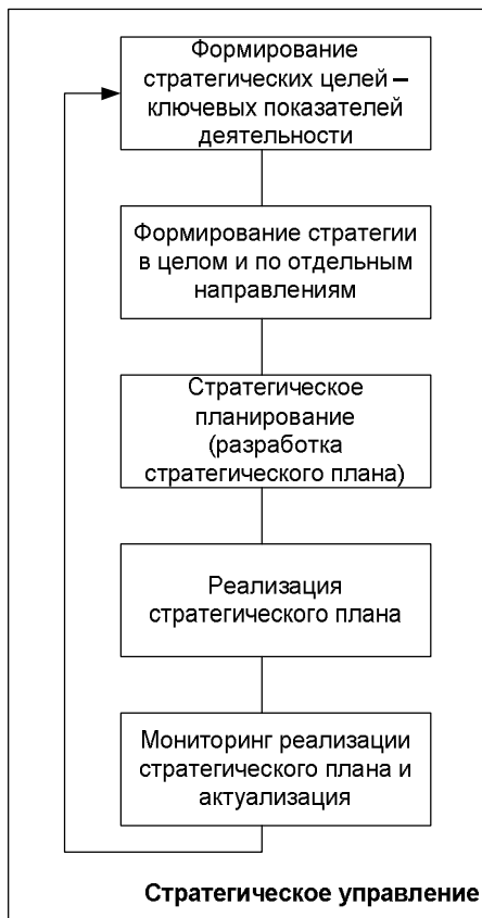
Рисунок 1. Основные процессы стратегического управления

На рисунке 1 представим основные процессы стратегического управления, а именно: