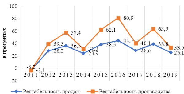
Рисунок 2. Динамика показателей рентабельности производства и реализации сои в Курской области, в %

На рисунке 2 представлена динамика показателей рентабельности производства и реализации сои сельскохозяйственными предприятиями Курской области.