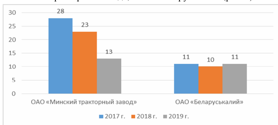
Рисунок 2. Количество зарегистрированных профессиональных заболеваний за период 2017–2019 гг. по предприятиям

Прослеживается повторяющаяся на протяжении длительного периода времени тенденция преобладающего уровня профессиональной заболеваемости среди работников предприятий ОАО «Минский тракторный завод», ОАО «Беларуськалий» (рис. 2).