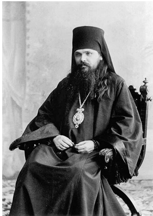
◀ Епіскап Мітрафан

Забаранялася прадаваць моцныя спіртныя напоі ў час царкоўных хрысціянскіх свят, урачыстасцей, звязаных з імператарскай сям'ёй (дні нараджэння імператара, імператрыцы і спадкаемца трона, гадавіна каранавання), а таксама ў дні кірмашоў, мясцовых сходаў, разгляду судовых спраў у валасных судах, у час прызыву навабранцаў і запасных [4, с. 138]. Продаж моцных напояў забараняўся таксама ва ўсіх дзяржаўных установах, у грамадскіх месцах і месцах народных гулянняў (тэатры, кінематограф, канцэрты, гарадскія сады і іншыя). У звычайныя дні продаж дазваляўся з 9 да 23 гадзін у гарадах і да 18 гадзін у сельскай мясцовасці.