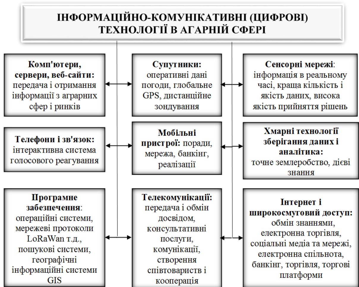
Рис. 1. Інформаційно-комунікативні (цифрові) технології в аграрній сфері [11–15].

Перехід аграрних підприємств до електронного сільського господарства може забезпечити використання сучасних цифрових технологій, таких як: комп'ютери, сервери, вебсайти, що дозволяють передачу та отримання інформації щодо аграрної сфери та ринків сільськогосподарської продукції, сировини тощо; різноманітні мобільні пристрої, які допомагають швидко знаходити інформацію, містять поради, доступ до банкінгу, інформацію по реалізації тощо; супутники дозволяють отримувати оперативні дані погоди, глобальне позиціонування GPS, дистанційне зондування; телефони та зв'язок це інтерактивна система голосового реагування; телекомунікації дозволяють провадити передачу та обмін досвідом, консультативні послуги, комунікації, створювати спільноти та розвивати кооперацію; сенсорні мережі (рис.1).