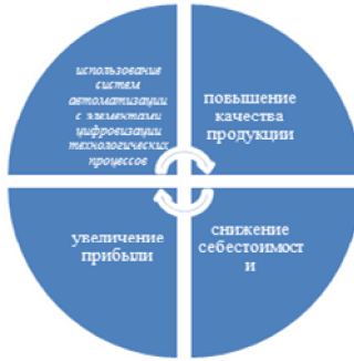
Рисунок 2 – Цикличность

Внедрение и успешное использование систем автоматизации с элементами цифровизации технологических процессов способствует повышению качества продукции, поскольку новые технологические оборудования исключают ошибки в технологическом процессе, улучшают систему кормления и водоснабжения животных, совершенствуют способы содержания поголовья.