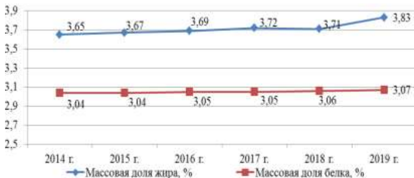
Рисунок 2 – Содержание жира и белка в коровьем молоке [1], %

Для повышения конкурентоспособности молочной продукции Республики Беларусь на мировом рынке молокопроизводителям необходимо повышать состав основных ценных компонентов молока – белка и жира. Базисная норма массовой доли жира молока принята на уровне 3,6%, а белка – на уровне 3,0%, изменение их содержания за 2014–2019 гг. в Республике Беларусь представлено на рисунке 2.