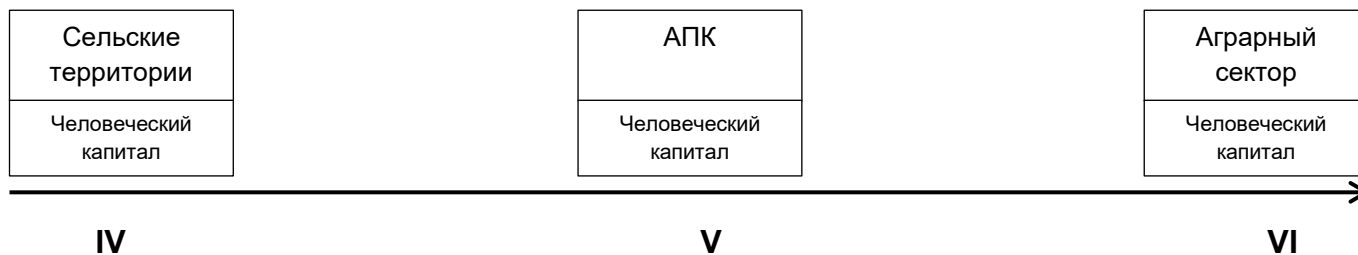
Рисунок 1. Изменение соотношения человеческого капитала сельских территорий, человеческого капитала АПК и человеческого капитала аграрного сектора при смене технологических укладов.

Накопление знаний в аграрной сфере, специализация видов ее деятельности, реализация направлений ее развития обуславливают внедрение индустриальных приемов в практику хозяйственной деятельности. В результате происходит горизонтальная диффузия аграрного и промышленного методов производства, формируя тем самым, агроиндустриальный труд. Дальнейшее развитие этой сферы способствует формированию вертикальной кооперации и интеграции в процессе промышленной переработки сельскохозяйственного сырья.