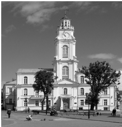
Малюнак 1 – Ратуша ў цэнтры Віцебска

У цэнтры Віцебска знаходзіцца сімвал, важны для кожнага жыхара горада, – гэта ратуша (малюнак 1). Калі ў горадзе ёсць ратуша, значыць, ён незалежны. Пабудоваць ратушу на гарадской плошчы маглі толькі ў тых гарадах, якім было падаравана Магдэбурскае права. Першая віцебская ратуша была драўлянай, яе разбурылі, калі горад пазбавілі Магдэбурскага права. У 1775 годзе на тым жа месцы была пабудавана новая ратуша, менавіта яна і дайшла да нашых дзён. Зараз у гэтым будынку размешчаны Віцебскі абласны краязнаўчы музей.