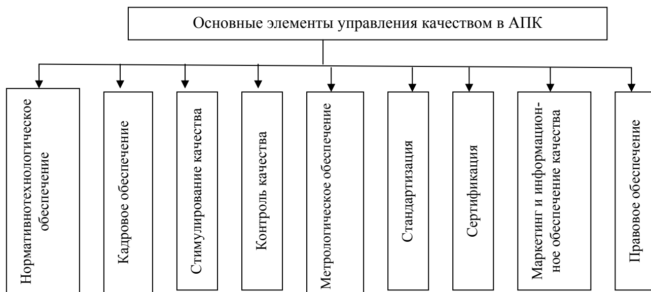
Рисунок – Основные элементы современного управления качеством

К важным элементам обеспечения качества реализуемой продукции является стандартизация. Стандартизация – это деятельность, направленная на достижение упорядочения в определенной области посредством установления правил для всеобщего и многократного применения в отношении реально существующих потенциальных задач.