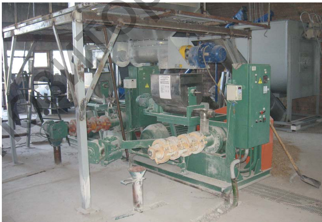
Рис. 1 - Линия переработки отходов к протеинову кормовую добавку