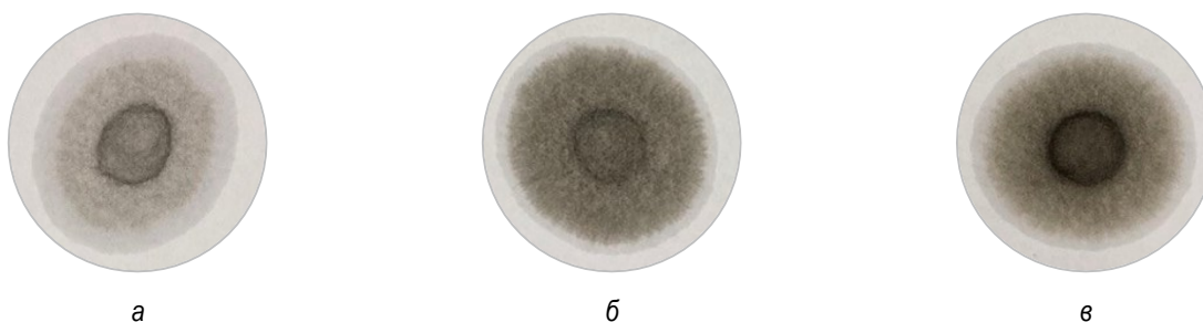
Рисунок 2 – Хроматограммы моторного масла марки Лукойл Авангард 10W40 с различной наработкой: а – 30 ч; б – 100 ч; в – 150 ч

Апробация метода оценки МДС проводилась на маслах марки Лукойл Авангард 10W40 с различной наработкой. Результаты полученных хроматограмм представлены на рисунке 2.