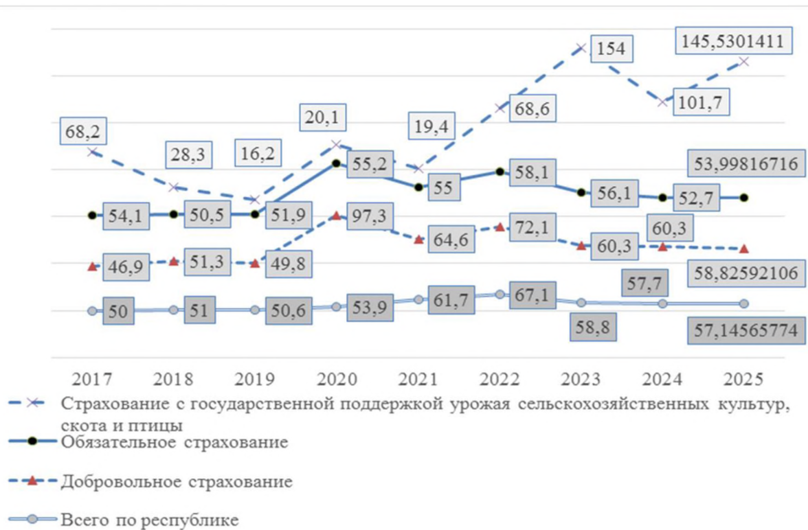
Рисунок 2. Доля страхового возмещения в страховых взносах, % Примечание. Выполнен автором на основе данных Министерства финансов Республики Беларусь

свидетельствует о сложностях в планировании величины страховых тарифов.