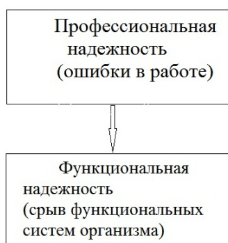
Рисунок 1. – Модель надежности профессиональной деятельности

Длительное время надежность профессиональной деятельности была представлена двухкомпонентной моделью [1].