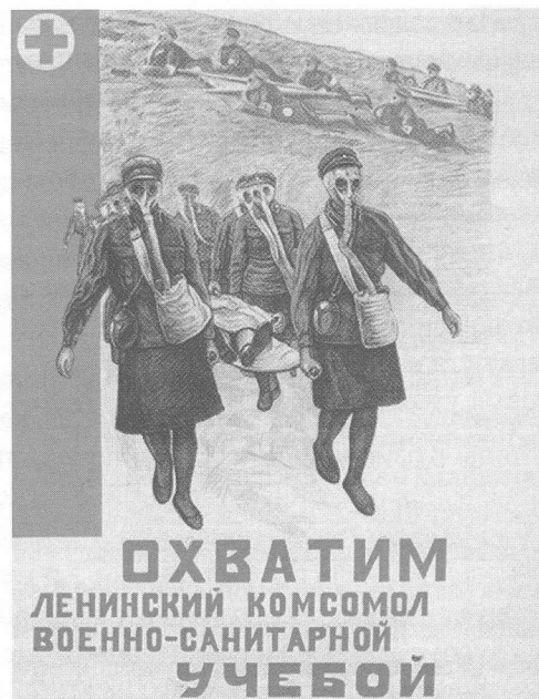
Агитплакат 1920–30-х годов

Проведенное автором исследование архивных источников подтверждает наличие многочисленных проблем в военной подготовке молодежи, связанных с объективными и личностными факторами. Они обуславливались сложностями налаживания системы работы, подготовки кадров, формирования материальной базы обучения, осуществления приоритетных направлений военной выучки молодых людей. Решением бюро ЦБ КП(б)Б (декабрь 1924 года) окружным, районным партийным комитетам предписывалось незамедлительное проведение мер по созданию при партийных комитетах междуведомственных совещаний и советов содействия допризывной подготовке, налаживание системы военного обучения юношества. Однако, как показало изучение, построение организационных структур руководства допризывной