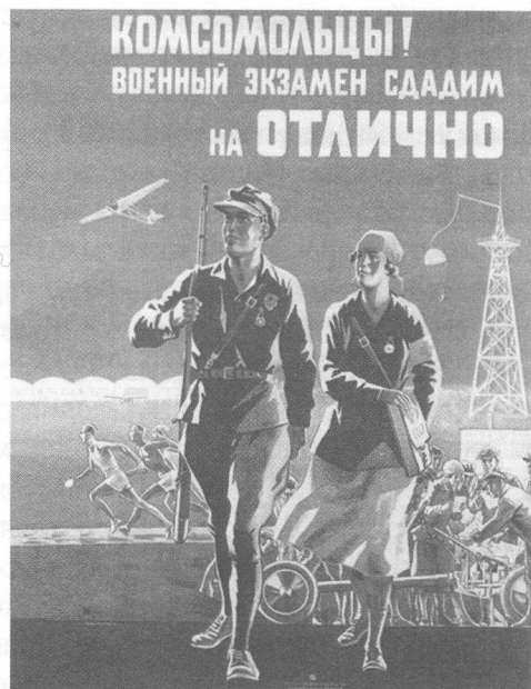
Агитплакат 1920–30-х годов