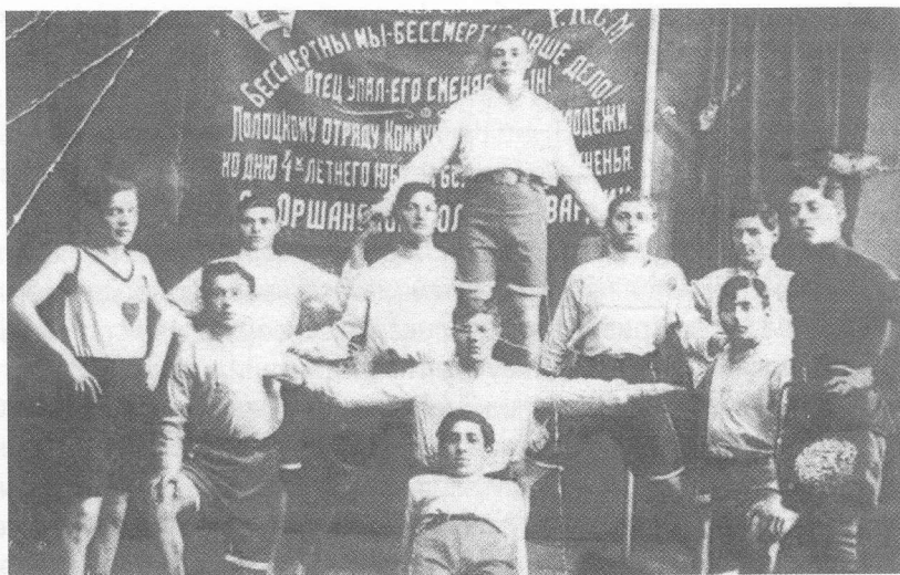
Полоцкий комсомольский спортивный кружок. Середина 1920-х годов

VIII КП(б)Б, VI РЛКСМ, VII ЛКСМБ съездов партии и комсомола, состоявшихся с мая по июль 1924 года, поставлена задача значительно повысить качество военного обучения юношей и девушек. Налаживание системы допризывной подготовки молодежи возлагалось на союзные, республиканские, окружные, районные партийные, советские органы, военные округа, военкоматы, территориальные, линейные войсковые соединения и части, общественные организации, оборонные патриотические общества [10].