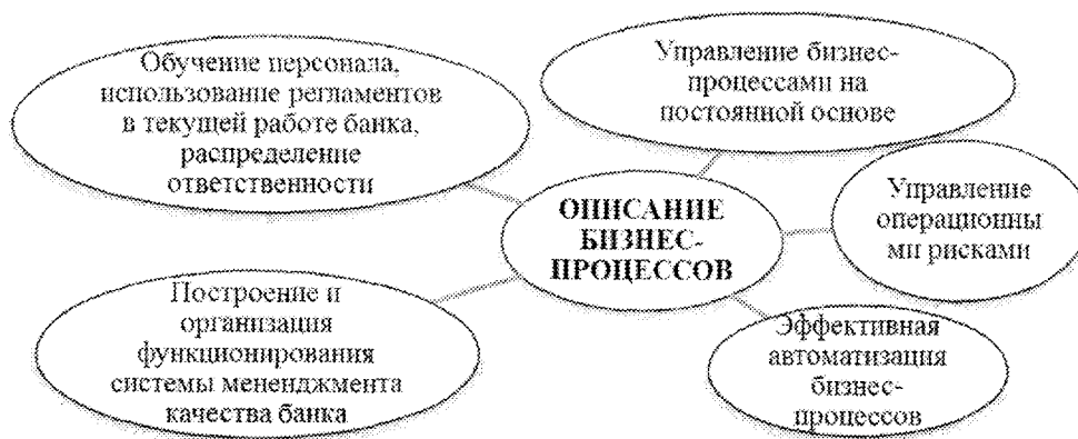
Рисунок 2. – Практические задачи, следующие из описания бизнес-процессов

Примечание – Источник: составлено автором [6, 7].