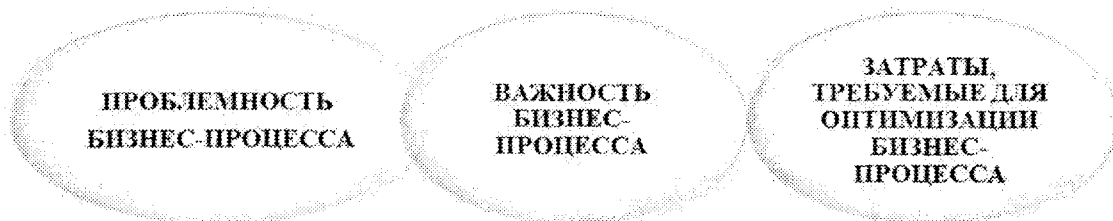
Рисунок 3. – Критерии определения перечня приоритетных бизнес-процессов банка

Следовательно, в условиях усложнения и повышения неопределенности внешней среды ведения банковского бизнеса оптимизация бизнес-процессов может обеспечить существенное сокращение издержек, основу для расширения и развития банковского бизнеса,