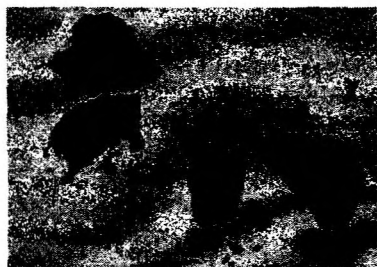
Рис. 3. Фотография частицы порошка после модифицирования индивидуальным магнетитом, олеиновой кислотой и полимером

ми, содержащими наряду с магнетитом добавки олеиновой кислоты и полимера (примеры 3, 4), примесей незакрепленного магнетита и округления острых граней не наблюдается (рис. 3).