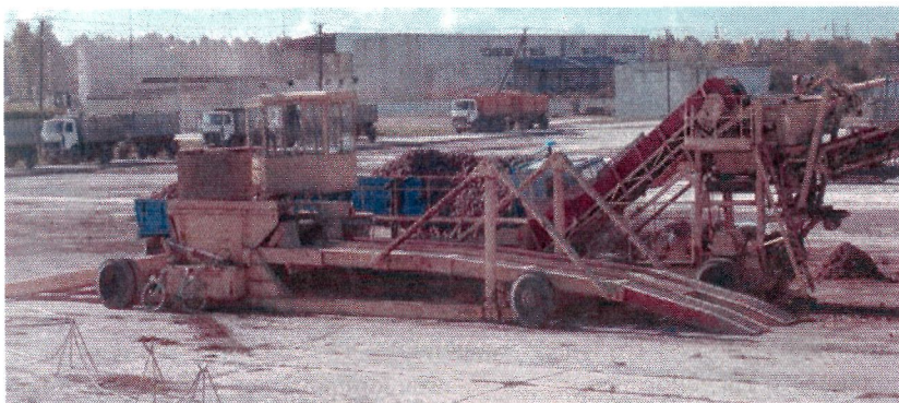
Рисунок 1 – Общий вид электрифицированной буртоукладочной машины

Материал и методика исследований. Буртоукладочная машина предназначена для укладки корнеплодов свеклы в крупногабаритные бурты (кагаты). В настоящее время на свеклоперерабатывающих предприятиях используются варианты с приводом от энергосредства в виде гусеничного трактора ДТ-75 или электрифицированные (более современный вариант) с приводом от электродвигателей. Сменная производительность таких машин находится в пределах 500-1500 т свеклы в сутки. Данные машины оснащены опрокидными площадками, обеспечивающими разгрузку бортовых автомобилей, автосамосвалов или автопоездов без расцепки, включая полуприцепы всех марок свекловичного транспорта (рисунок 1).